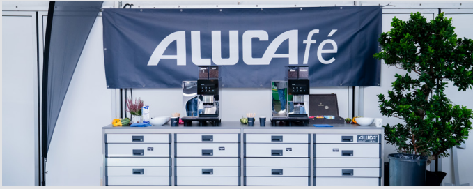
Branding Kaffee-Theke und Tassen mit eurem Logo.