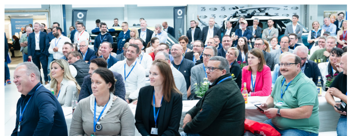
Zugriff auf die Teilnehmerdaten 4 Wochen vor Event aller Angemeldeten (die eingewilligt haben) und nach Event der tatsächlich Anwesenden.