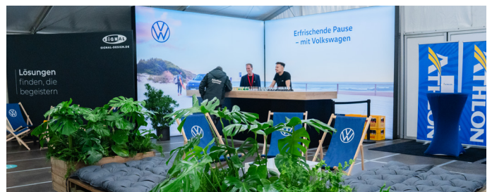
Branding Bar bei Flottentag und Abendveranstaltung. Getränke stellt SIGNAL bereit.