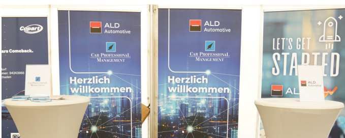
Werbemittel-Paket: Branding für 500 Kugelschreiber, 2 Roll-ups und 500 Ritter Sport Minis inkl. Handling und Bereitlegung am Stand.