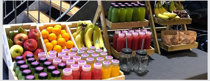
Gebrandeter Smoothie- oder Orangensaftstand, optional mit eigenen Produkten.