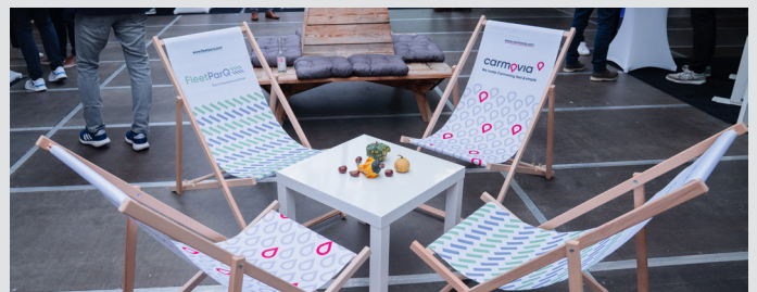
Produktion von 4 Liegestühlen für Sitzinseln. Die Liegestühle gehen danach in euren Besitz über.